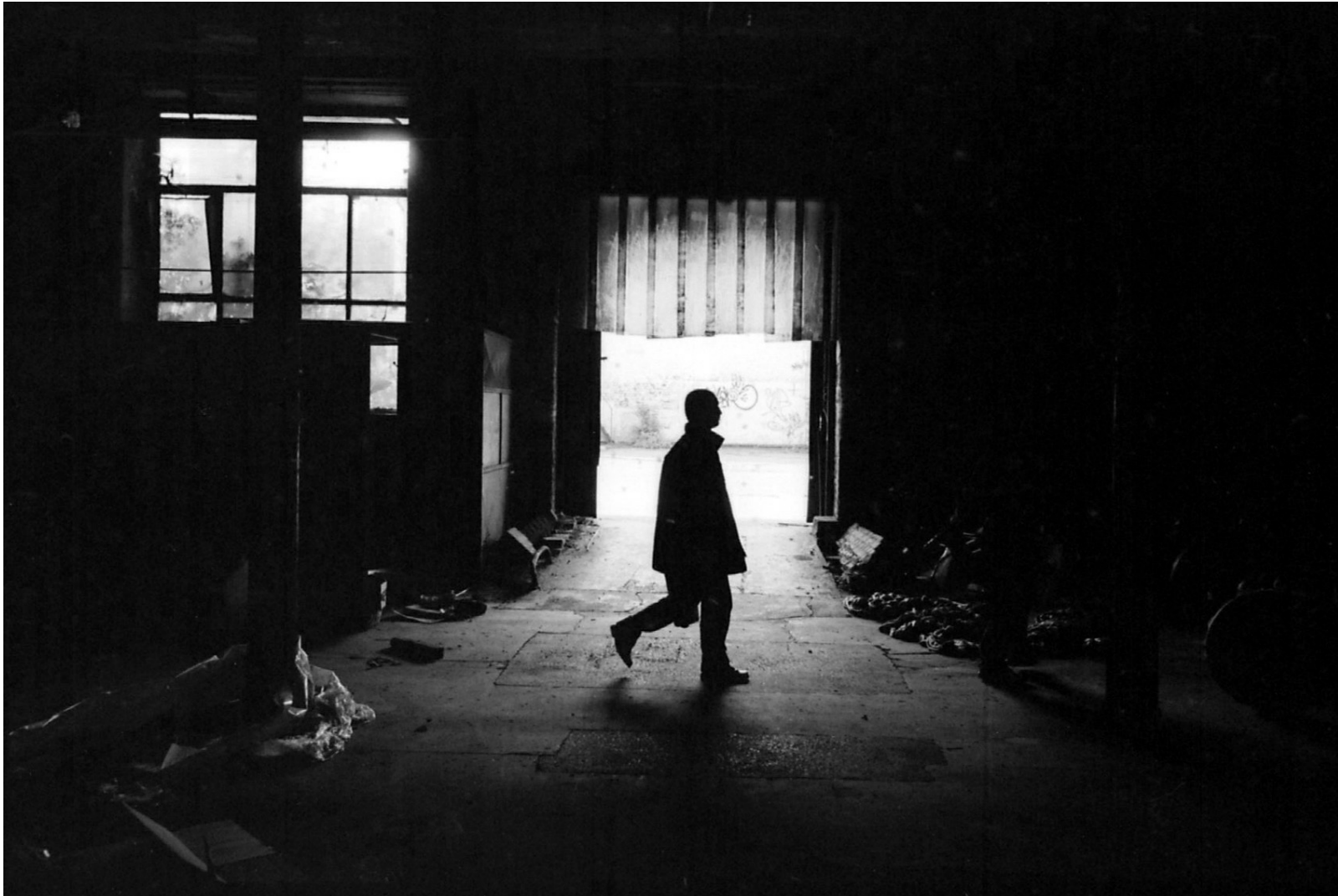
Filature Mossley, 2004. Documentaire sur les anciens ouvriers de la filature Mossley, Hellemmes, France.