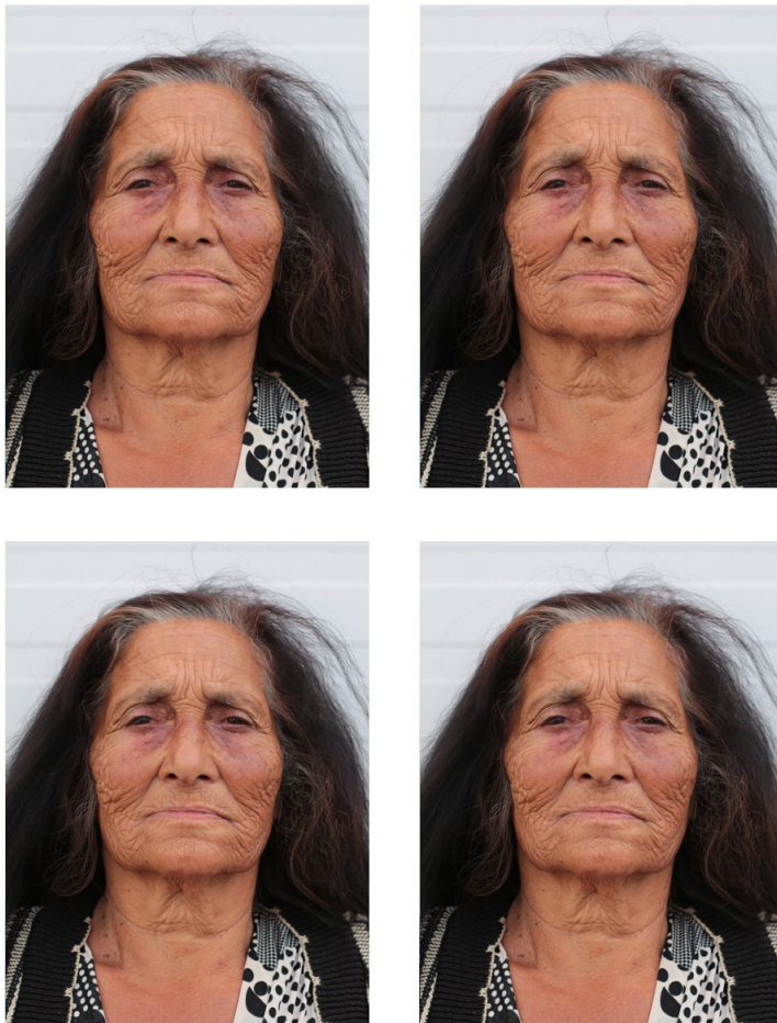
Non conforme, 2016 (en cours). Portraits fictionnalisés d'aînés de la communauté des Gens du Voyage, Métropoles de Lille et Valenciennes, France.