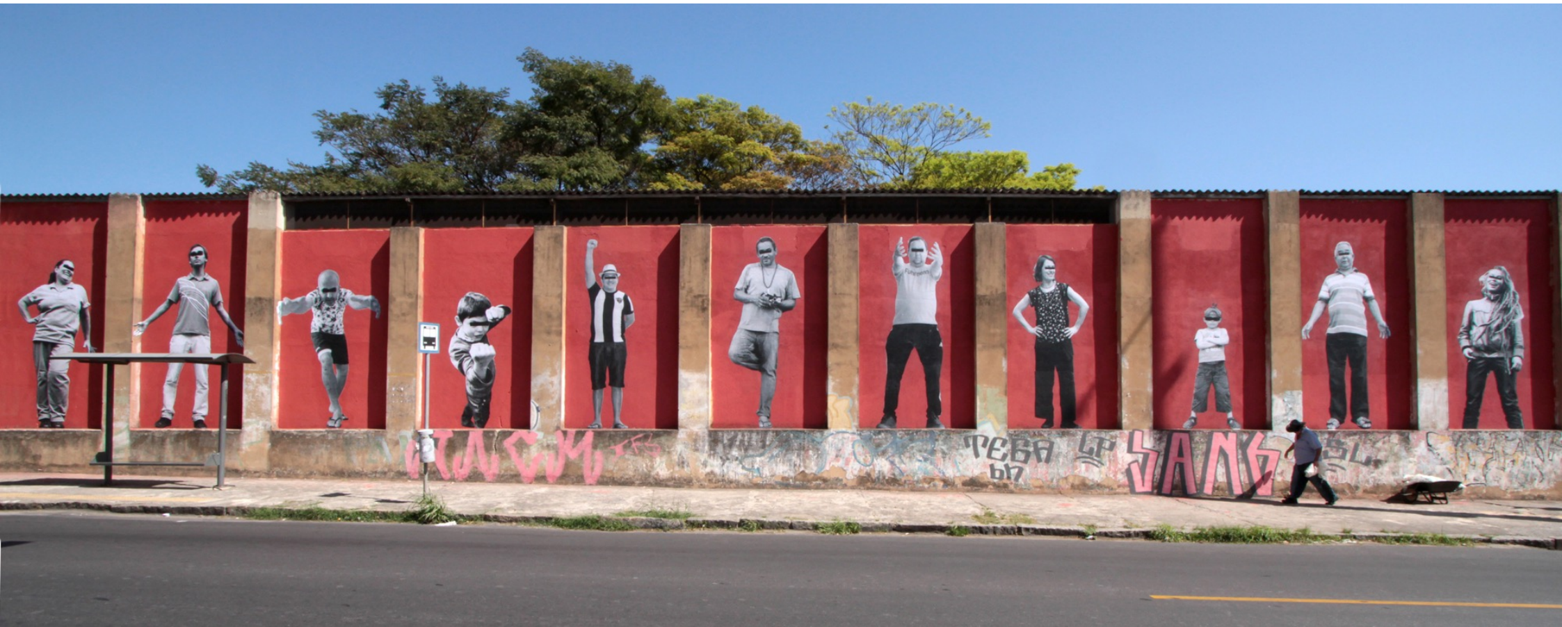
Jacarela Udigrudi Crew, 2015. Installation/collage de portraits d'habitants du quartier de Santa Branca, Belo-Horizonte, Brésil.