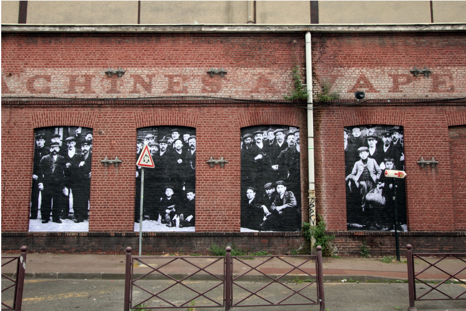
Regarder/Voir un quartier, 2012. Installation/collages de photos d'archive sur l'histoire sociale et politique du quartier de Moulins, Lille, France.