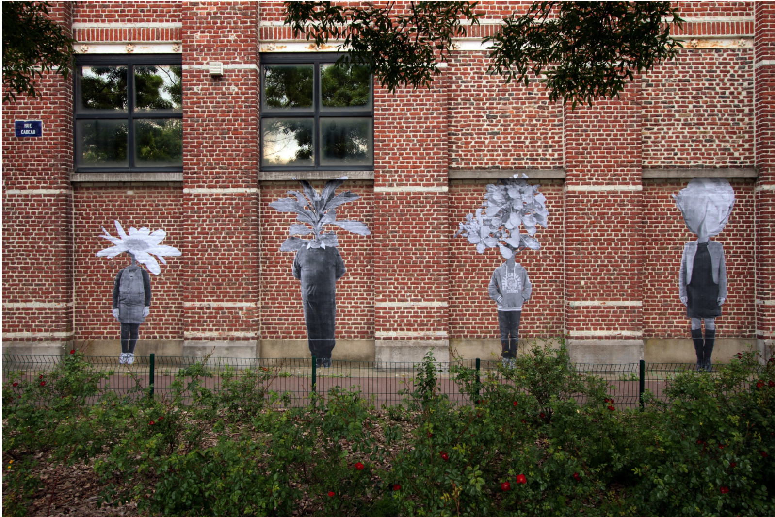
La mauvaise herbe, 2015. Installation/collage de portraits hybrides d'habitants du quartier de l'Union, Tourcoing, France.