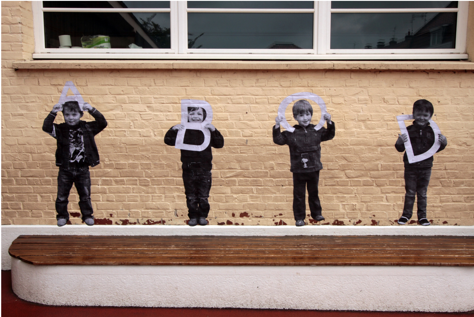
Abécédaire, 2012 / Comme Modigliani 2016. Installation/collage de portraits d'enfants au cours d'ateliers, école Anatole France, Lille, France.