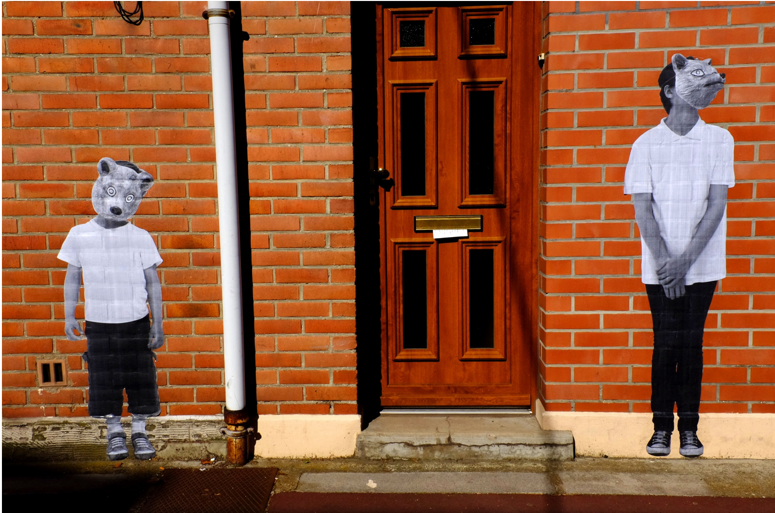
Rêves d'habitants, 2014. Installation/collage de portraits d'habitants en animaux totem, Lomme, France.