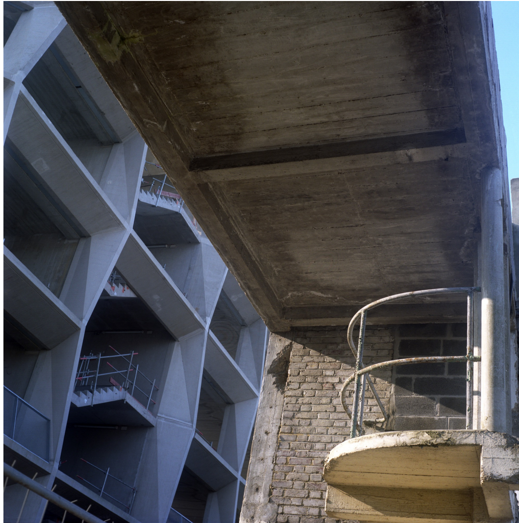
Yin-Yang / Défragmentation 2015. Abstraction architecturale, quartier de l'Union, Tourcoing France.