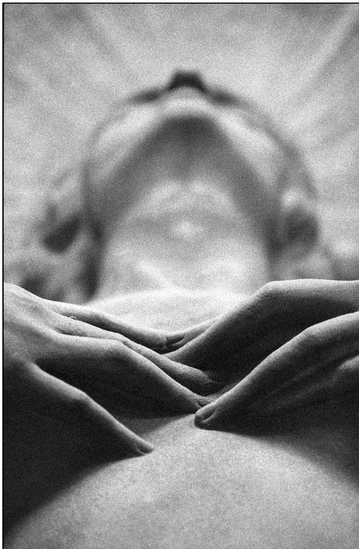
Le vacarme et le silence, 2016 (en cours). Série sur l'esthétique de la statuaire italienne au cours de la résidence Wicar, Rome, Florence, Gênes, Italie.