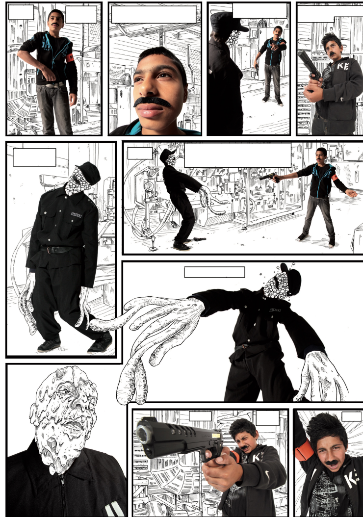
Poulet-frites, 2013 (en cours). Roman photo (technique mixte) réalisé en atelier avec la classe d'UPE2A du collège Boris Vian, Lille, France.