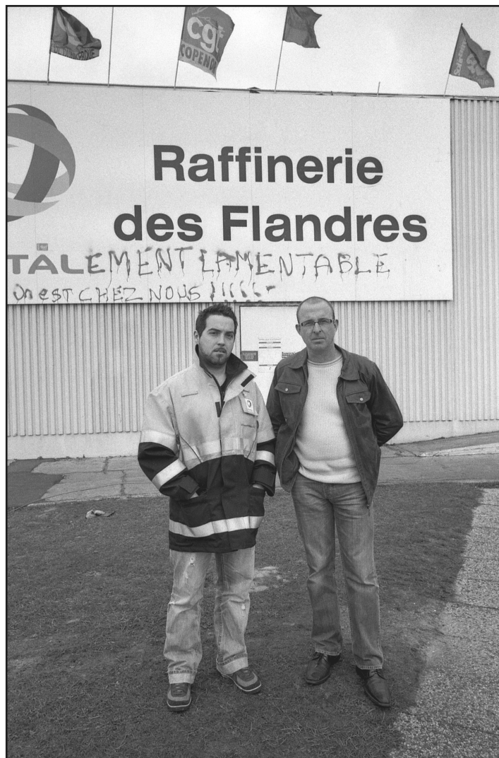
Gain de cause, 2010. Portraits des ouvriers en grève de la raffinerie Total à Grande Synthe, France.