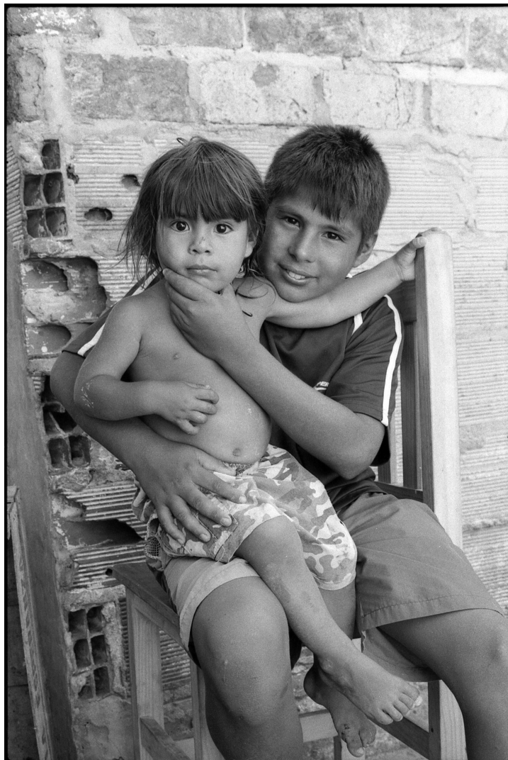
Salade d'orchidée, 2005. Reportage documentaire sur les luttes sociales et culturelles à Buenos Aires, Argentine.