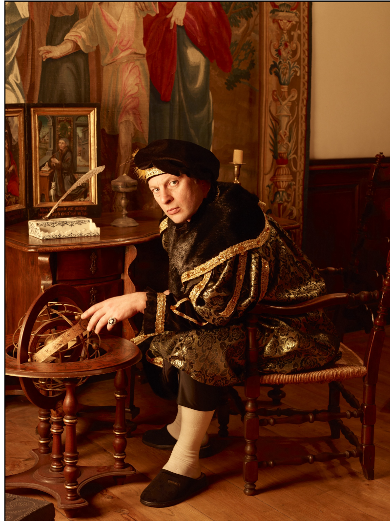
La famille Bobeaucourt, 2012. Portraits de personnages fictifs pour l'installation LEM-Utopia à l'hôtel Beaulincourt, clôture de Béthune Capitale Culturelle.