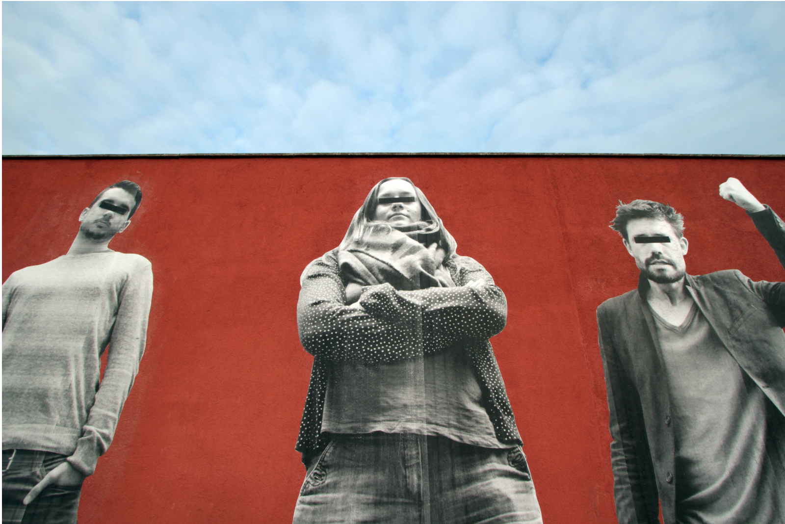
Family, 2015. Installation/collages de portraits masqués, Biennale d'Art Mural, Hellemmes, France.