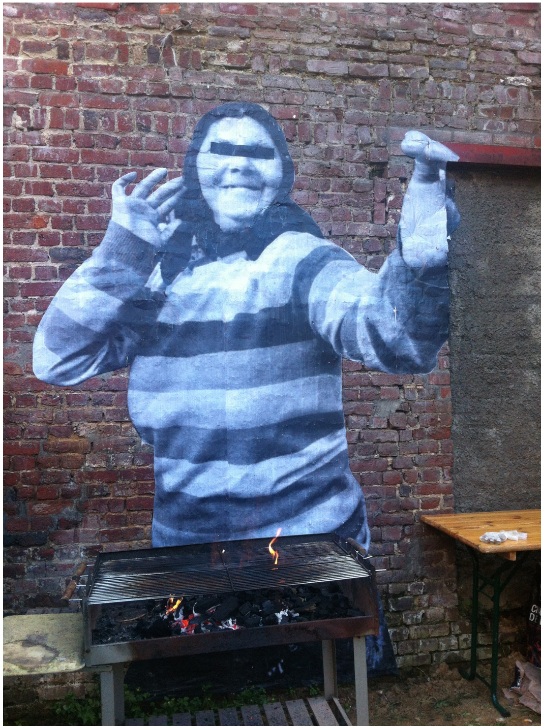
Désintégration sociale Portraits de Roms avant expulsion. Hôpital Saint Antoine, Lille, avril 2014. 8 Collages papier, Formats variables. Extraits