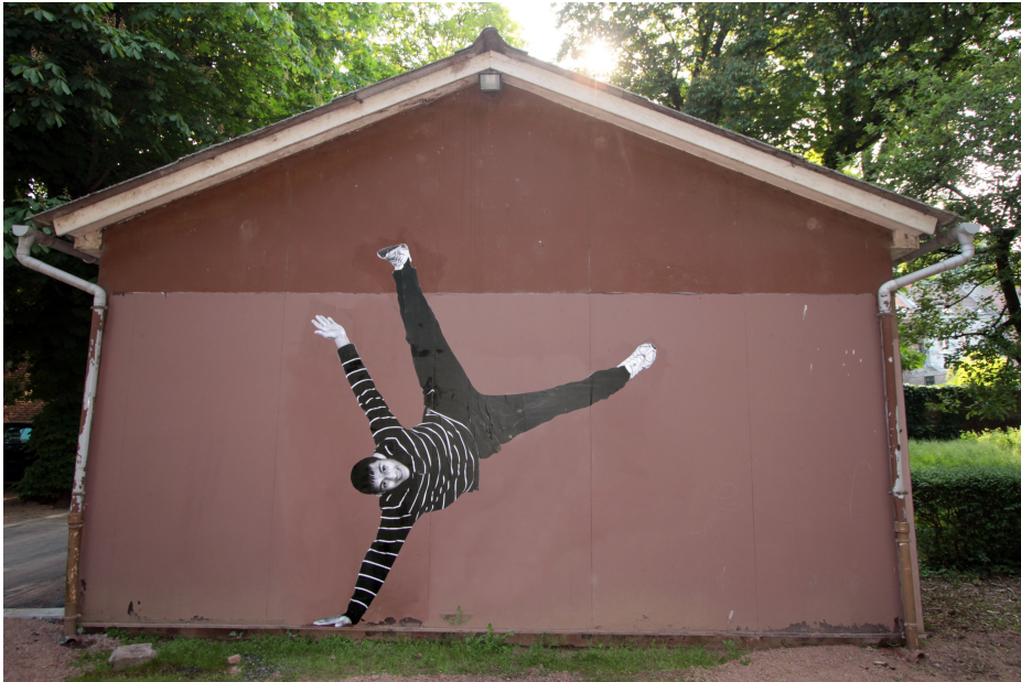
Marc Mounier-Kuhn 13