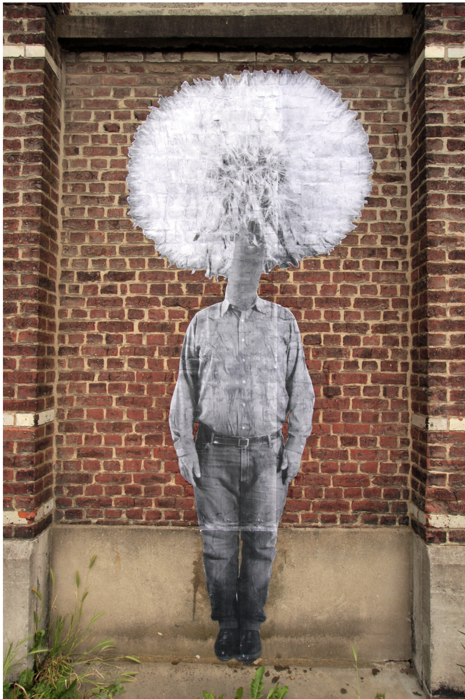
La mauvaise herbe Regards d'artistes sur l'Union exposition collective par le Groupe A Coopérative culturelle Tourcoing mai 2015 10 collages papier formats approximatifs 3,5 m