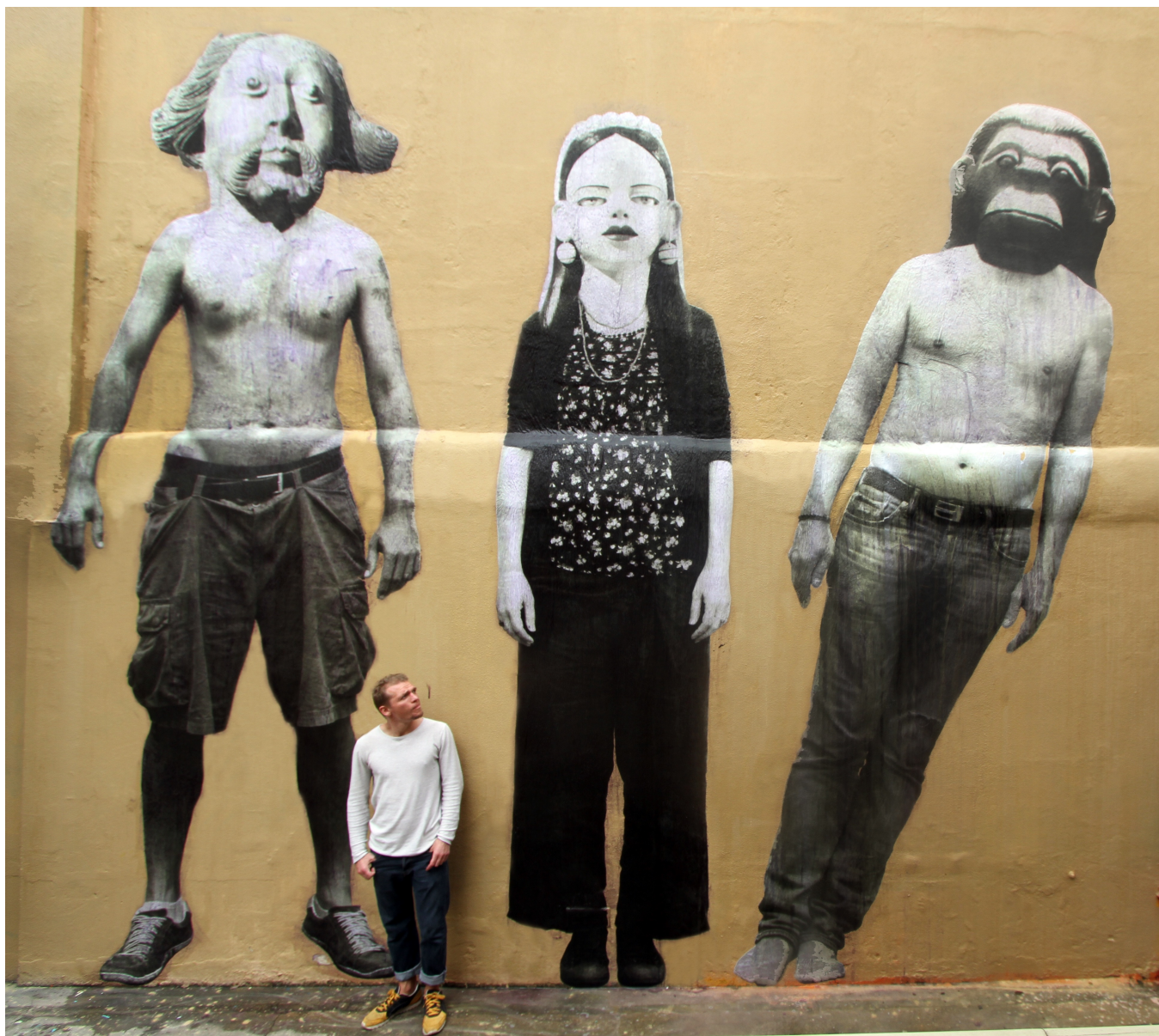
Spiritus, Sensualidad & Anima Installation collective, Projeto de Arte mural Centro de arte popular CEMIG, Belo Horizonte, Brésil, décembre 2014. 3 collages papier, Formats approximatifs 6m