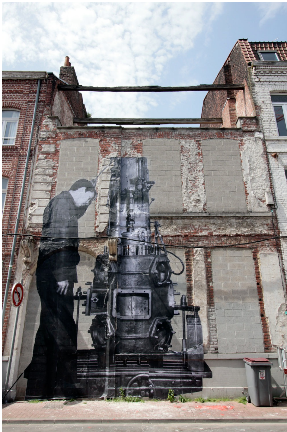
Le silence de Tiresias Regarder/voir un quartier. Avec le Groupe anonyme. Quartier de Moulins, Lille, juin 2012. 25 collages papier sur l'histoire politique et sociale du quartier. Formats variables Extraits.